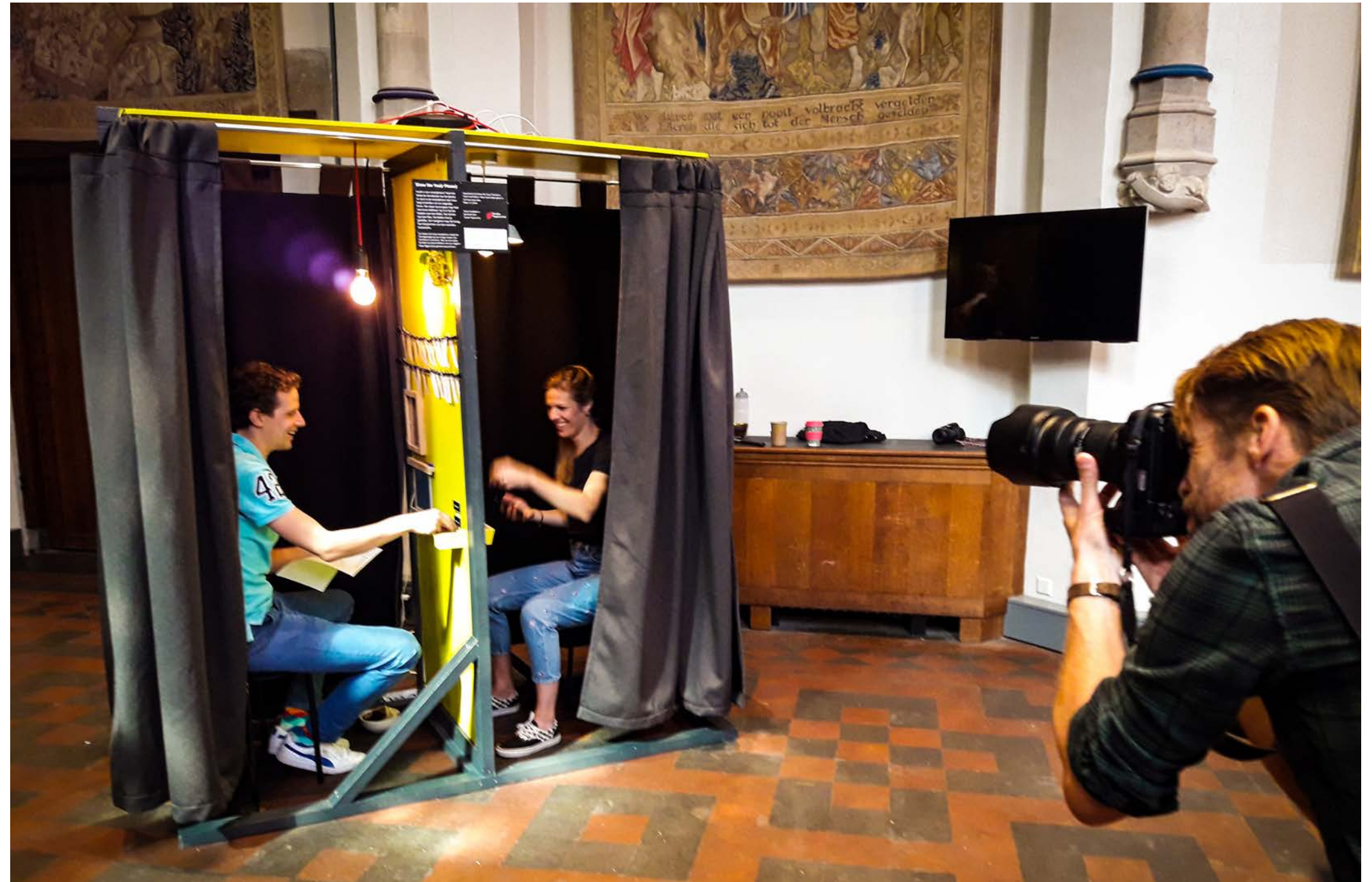
Show Me You(r) Phone) op Uitfeest in Utrecht, 15 sept 2019.

De relatie met onze smartphone maakt dat het apparaatje op een innige manier met ons leven is verweven. Wat zou een ander op basis van jouw telefoon over jou zeggen? Waar liggen jouw grenzen qua privacy? Hoe voelt het om op basis van enkel datapunten te worden geprofileerd? Show Me You(r) Phone stelt deze innige relatie met de telefoon in een prikkelend experiment centraal.