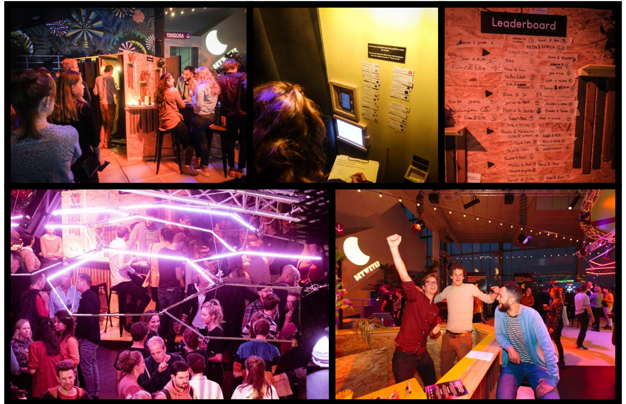
Show Me You(r) Phone) op Betweter Festival in Utrecht, 4 oktober 2019.

Deelnemers vinden het leuk, interessant, en het zet aan het denken. Even in de buurt blijven en dan ook eens de andere kant proberen!